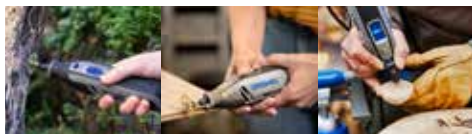
Punho de uma mão - Punho de duas mãos - Punho tipo lápis

O punho tipo lápis é usado principalmente para gravar; polir aplicações detalhadas.